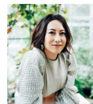
一青窈 さん 曲名：ハナミズキ