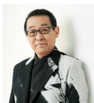
さだまさし さん 曲名：心かさねて～長崎の空から～