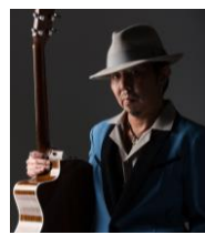
大事MANブラザーズ立川俊之 さん 曲名：それが大事