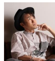
ナオト・インティライミ さん 曲名：未来へ