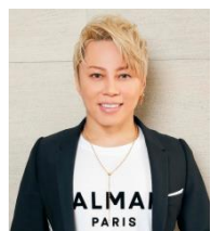
西川貴教 さん 曲名：Lakers